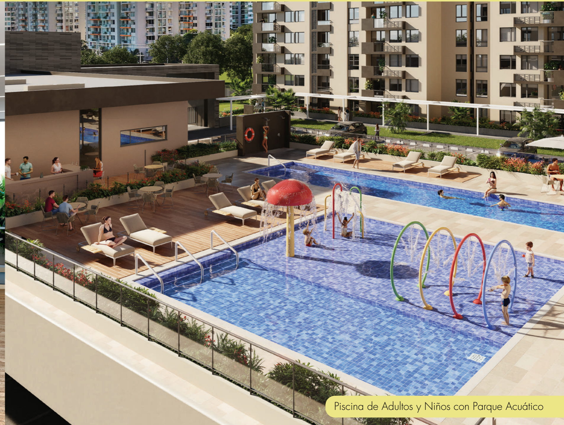
Piscina de Adultos y Niños con Parque Acuático