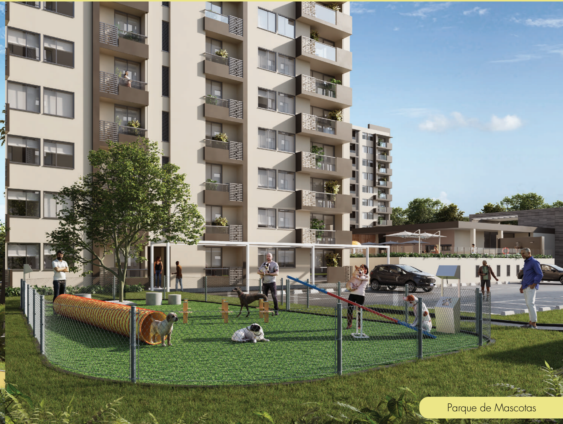
Parque de Mascotas