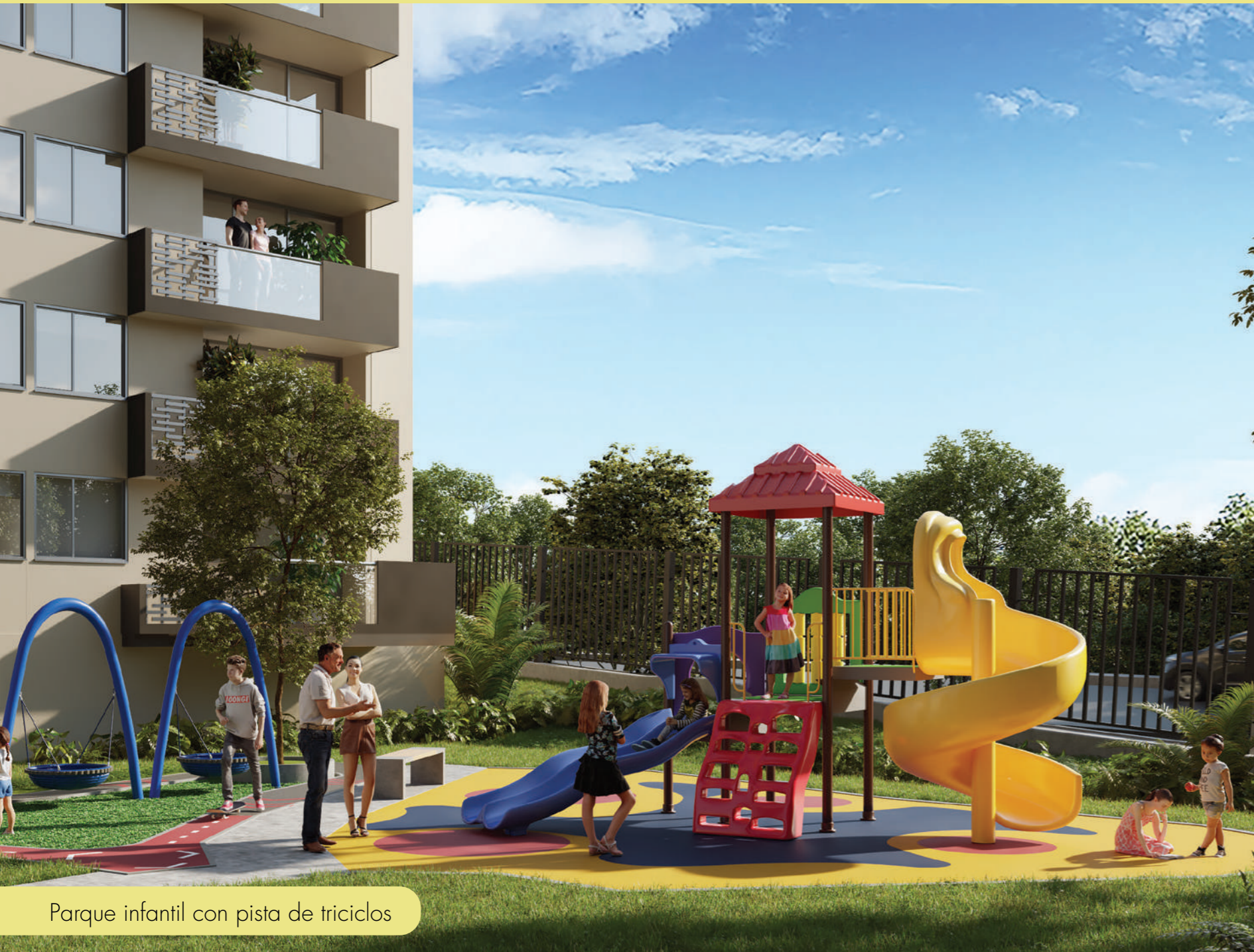
Parque infantil con pista de triciclos